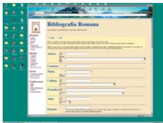
Schermata di interrogazione della Bibliografia Romana disponibile on line sul sito del Croma, sezione "Bibliografia Romana"