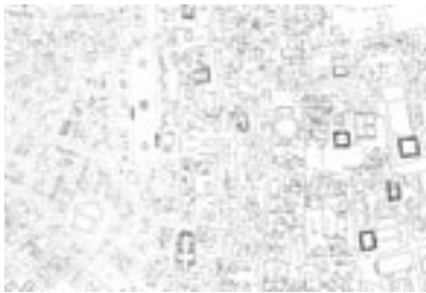
Georeferenziazione e informatizzazione del Catasto urbano Pio-Gregoriano (1818-24)