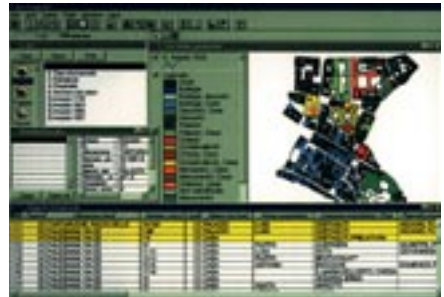
Collegamento delle banche dati relative ai registri del catasto Pio-Gregoriano con il supporto cartografico informatizzato. Caso di studio del Rione Sant'Angelo

Il progetto, sviluppato in collaborazione con la Provincia di Roma (Ufficio Studi) e i comuni interessati, intende sviluppare in via sperimentale le metodologie già implementate nell'ambito del programma di ricerca su Roma, sui territori di Anzio e Nettuno.