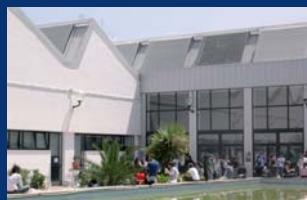
Lettere e Filosofia