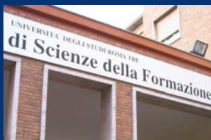
Scienze della Formazione