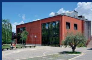
Scienze Matematiche, Fisiche e Naturali