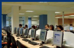
I servizi di Roma Tre