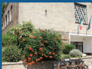
Matematica e Fisica