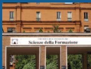
Scienze della formazione