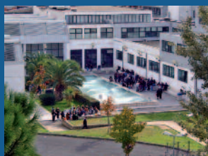
Filosofia, comunicazione e spettacolo