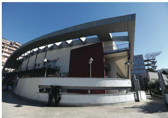
Progetto Grafico: Giuseppina Domenica

Progetto Grafico: Area di Supporto Tecnologico alla Comunicazione e alle Relazioni con i Media